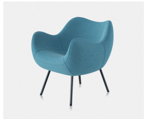
FOTEL RM58 SOFT

producent | producer: VZÓR sp. z o.o. Warszawa projekt | design: Roman Modzelewski